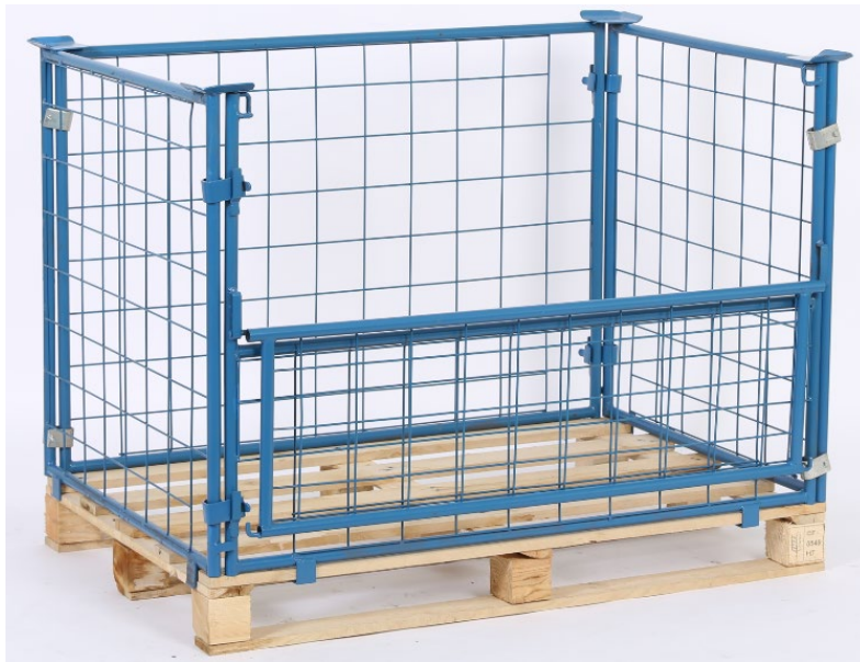
rozložený kontejner / rozložený kontejner / rozłożony / gefalteter Container

Rozložený kontejner zaháhněte pomocí háků na paletu.