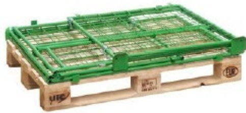
složený kontejner / zložený kontejner / złożony / ungefalteter Container